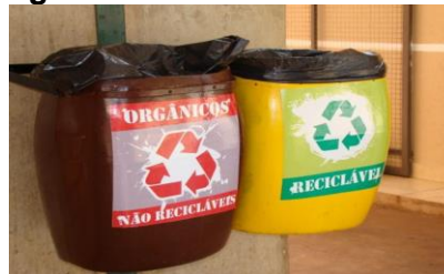
Figura 18. Lixeiras identificadas

Foram implantados inicialmente no Bloco “B” coletores para a segregação dos resíduos orgânicos e recicláveis, utilizando embalagens vazias de produtos químicos usadas no sistema de tratamento de águas de refrigeração. Os coletores foram identificados com adesivos fixados, conforme mostrados na Figura 18.