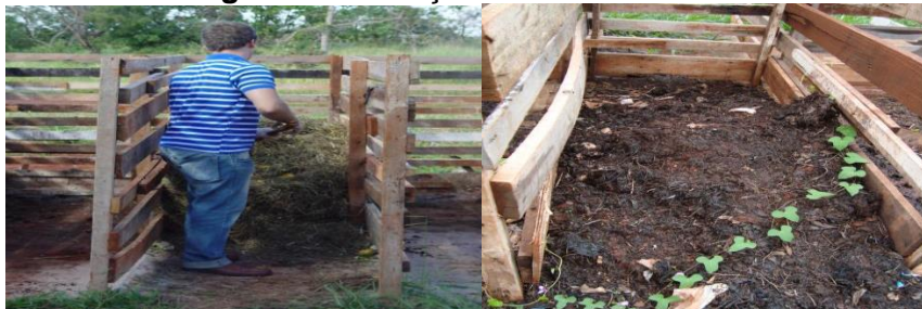
Figura 11. Redução do volume da leira

Observou-se que o composto perdeu 60% do seu volume em relação ao início do processo até o composto já estabilizado, onde deixou a leira com uma altura de 1m de resíduos e após 90 dias reduziu para 0,45m, como mostra a Figura 11.