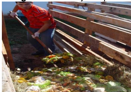
Figura 10. Manejo da pilha

Para controle da aeração e preservação das bactérias decompositoras foi necessário o revolvimento manual da pilha de compostagem como mostra a Figura 10.