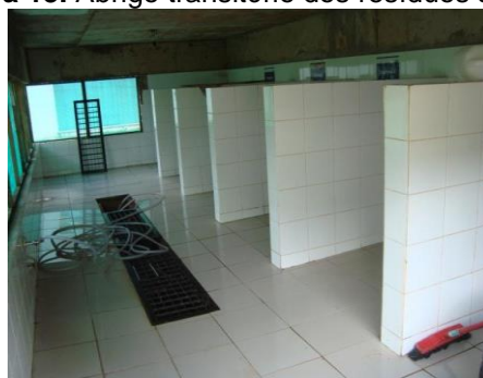
Figura 13. Abrigo transitório dos resíduos sólidos

Os resíduos gerados nas cantinas, lanchonetes e restaurantes foram acondicionados em sacos plásticos e depositados temporariamente em abrigos transitórios localizados nos blocos onde os geradores estão localizados. Na Figura 13 observa-se o abrigo transitório onde os resíduos são separados por origem até serem enviados para o acondicionamento em contêineres aguardando o recolhimento pela empresa contratada.