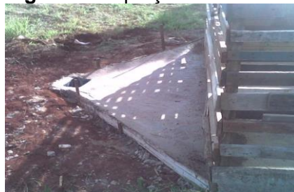
Figura 3. Captação do chorume

O chorume coletado, rico em nutrientes, foi utilizado no processo de manutenção da umidade da pilha de composto. Para evitar infiltração do chorume, a base da composteira foi pavimentada e com uma inclinação no sentido do reservatório instalado, como mostrado na Figura 3. No chorume coletado, resultante do lixiviado da massa do composto por ocasião da irrigação, encontram-se nutrientes (solúveis e insolúveis) e parte da microvida que se desenvolve na massa do composto.