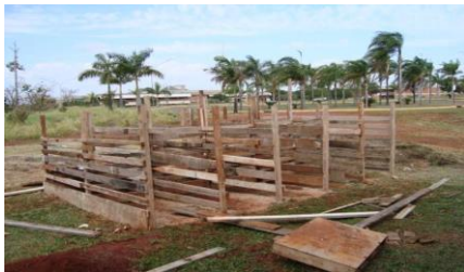
Figura 1. Construção da composteira

direcionado a um ponto onde foi implantado um poço para a coleta de chorume. Foram implantadas 10(dez) unidades para compostagem com dimensões de 1,50m de comprimento, altura de 1,10m e largura 0,80m. Para a construção das leiras de compostagem foram utilizadas sobras de madeiras de demolição e construção encontradas nas dependências da UCDB. As Figuras 1 e 2 mostram a implantação das composteiras.