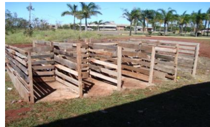
Figura 2. Construção da composteira