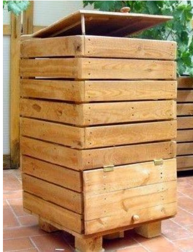
Figura 3. Composteira produzida com madeira reutilizada – pallets

Para melhor controle da temperatura e umidade, as composteiras podem possuir tampas e fundos, produzidos a partir do mesmo material, sendo necessário reposicionar as ripas de madeira para o completo fechamento. Na parte inferior, pode ser colocada uma lona impermeável para evitar a danos à composteira. Os controles de temperatura, umidade e revolvimento devem seguir as mesmas orientações aplicadas ao cenário 1.