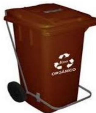
Figura 1. Recipiente recomendado para resíduos orgânicos

Para a coleta diária dos resíduos no restaurante, recomenda-se o uso de acondicionadores plásticos com tampa, para evitar que insetos e animais sejam atraídos, especialmente aqueles vetores de doenças, com acionamento via pedal por questões sanitárias, e com rodas, para facilitar o transporte dos resíduos até o local da compostagem, como o modelo ilustrado pela Figura 1. Se os acondicionadores forem esvaziados uma vez ao dia no sistema de compostagem, serão necessárias 7 unidades de 120 L cada para acomodar o montante de RSO produzidos, contemplando adequadamente toda a área do restaurante. Recomenda-se que os recipientes coletores para os resíduos orgânicos compostáveis sejam dispostos na parte interna do restaurante conforme critérios definidos pelos gestores do local, tanto na parte referente ao público atendido pelos serviços, quanto nas áreas de acesso restrito aos colaboradores.