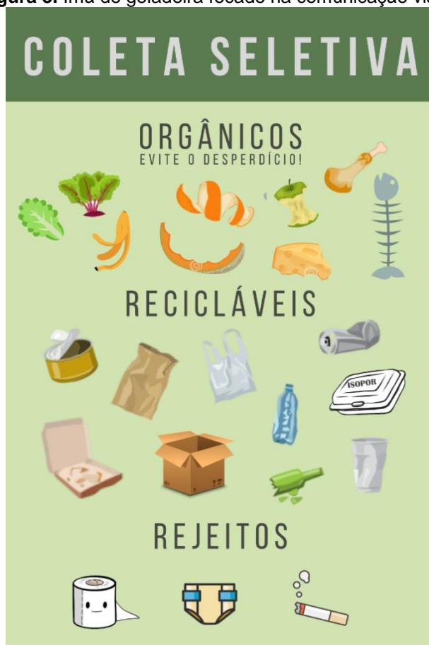
Figura 3. Ímã de geladeira focado na comunicação visual

realidade tende a ser diferente. Ademais, cerca de 20% da população residente se encontra na faixa de 5 a 9 anos, crianças que muitas vezes não são alfabetizadas. Desta forma, fez-se uso de linguagem simples e utilização de figuras na confecção dos materiais, objetivando facilitar a compreensão por todas as pessoas. Pode-se observar na Figura 3 a utilização de imagens no layout dos ímãs de geladeira, para garantir a compreensão de todos.