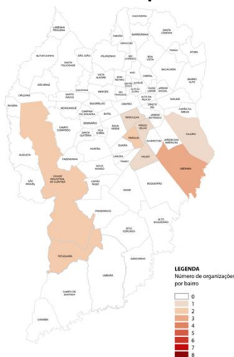
Figura 2 – Dispersão territorial dos compradores de materiais plásticos