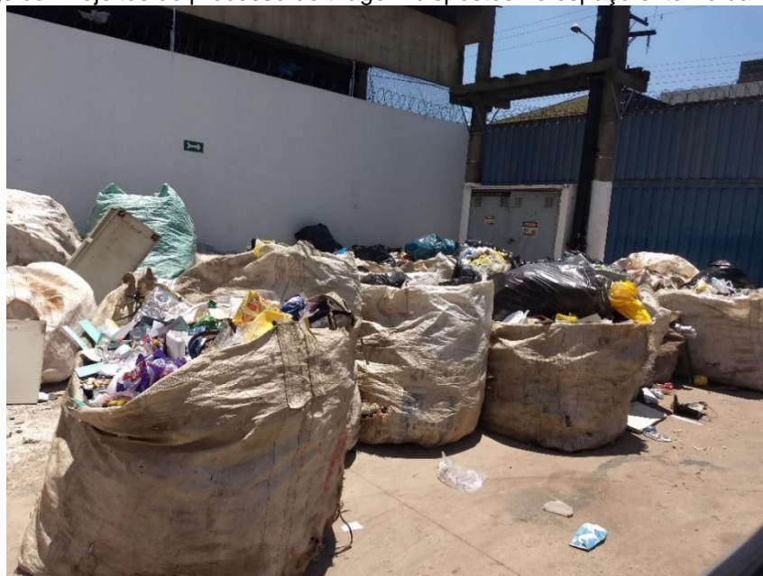
Figura 1. Bags com rejeitos do processo de triagem dispostos no espaço externo da COOPERVIDA.

Foi constatado que o processo de triagem na cooperativa consistia na dispersão dos resíduos coletados em uma mesa e na segregação desses materiais pelos cooperados, de acordo com as tipologias e os interesses dos compradores. A COOPERVIDA separava os materiais em 18 categorias, uma delas a de rejeitos (Figura 1), foco deste trabalho.